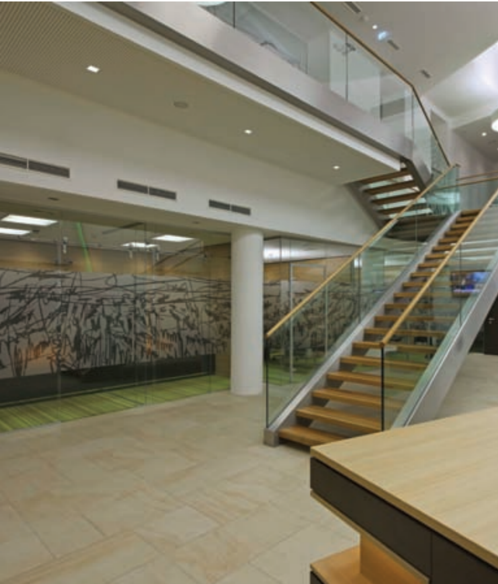
Aufgang I. OG