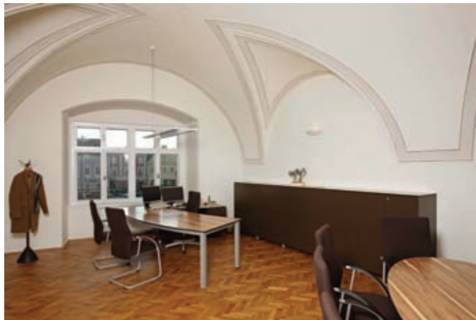
Direktion I. OG