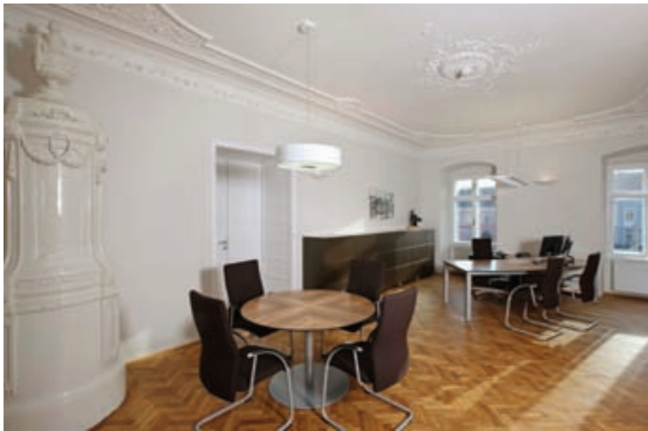
Direktion I. OG

Hervorzuheben sind die beiden historischen Räume, welche bisher ungenutzt waren und nun von den beiden Geschäftsleitern als Büro ausgestattet wurden. Durch die Verbindung von bestehender Bausubstanz mit dem attraktiven Neubau entsteht eine insgesamt spannende und immer wieder überraschende Raumabfolge.