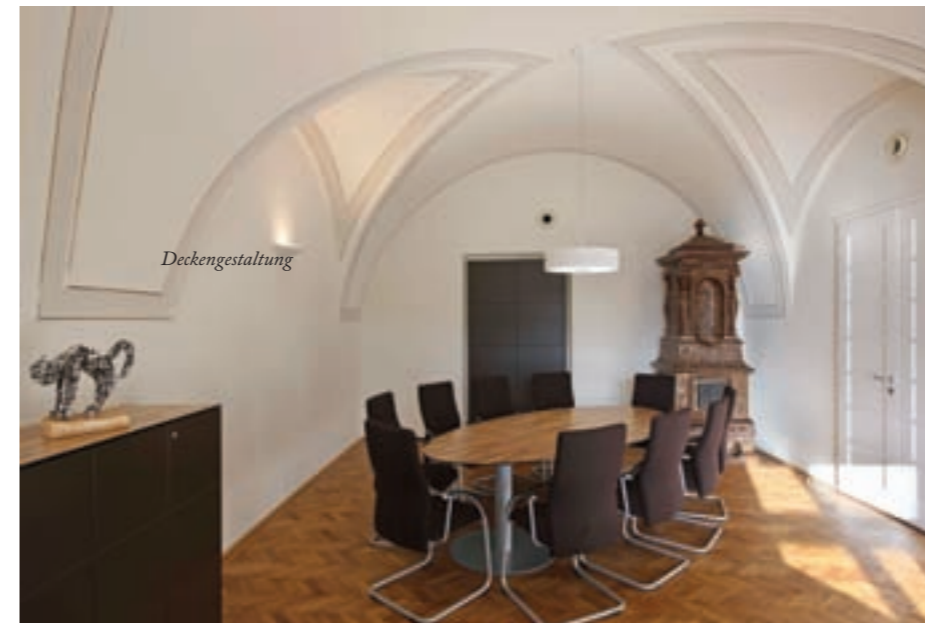
Direktion / Besprechung I. OG