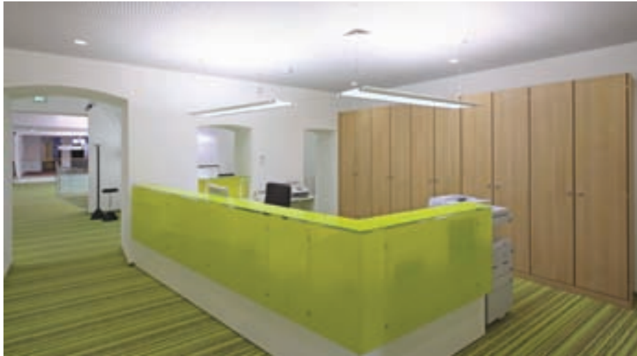
Empfang I. OG

ner äußerst interessanten Deckenlösung ein durchgängiges Lichterlebnis. Dieses wird von einer attraktiven und zeitgemäßen LED-Beleuchtung unterstützt, welche sowohl Raum- als auch Effektlucht bietet. Die in den Foyerbereich miteinbezogene Anordnung der Mitarbeiterplätze bietet nun Kunden wie auch Mitarbeitern die Möglichkeit zur unmittelbaren Kontaktaufnahme. Die Mitarbeiter stehen dem Kunden innerhalb der SB-Bereiche jederzeit und unaufdringlich zur Verfügung. Darüber hinaus sind im linken, geschützteren Bereich 2 Diskret/Barplätze.